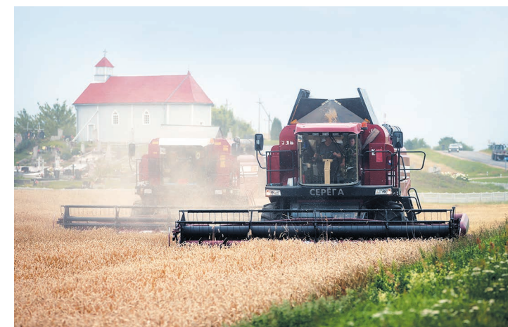
Механизаторы учебно-опытного СПК приступили к уборке пшеницы