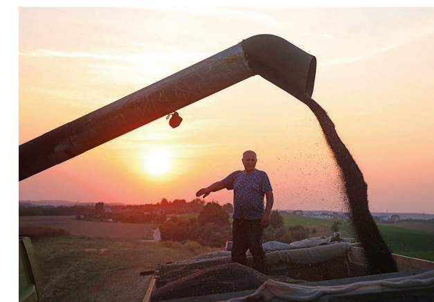
До заката солнца идет уборка рапса

Предприятие беспрестанно модернизируется и меняется, преображая заодно и все вокруг