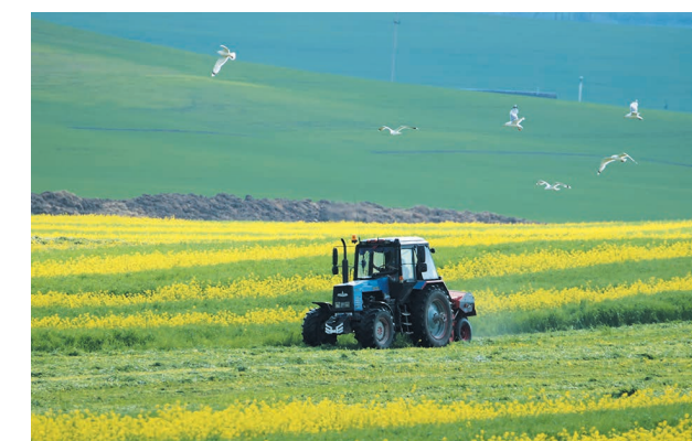
Заготовка кормов из смешанных посадок озимой сурепицы и ржи

Находит хозяйство средства и для того, чтобы помочь местной школе. Сейчас активно участвуют в строительстве стадиона.