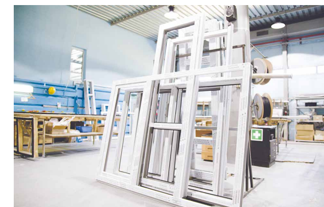
Цех по производству светопрозрачных конструкций из ПВХ профиля

– Выполнения планов развития намерены достичь за счет наращивания объемов производства, освоения новых видов продукции, оказания услуг по ремонту карьерной и специальной техники торговых марок «БЕЛАЗ» и «МоАЗ» и оборудования специального назначения (монтаж, ввод в эксплуатацию, наладка, ремонт и техоб-