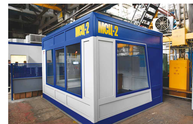
Готовая продукция – кабинет мастера

служивание), перевозке скальных пород на карьерах, оптовой торговли автомобильными деталями, узлами, принадлежностями, а также экспорта.